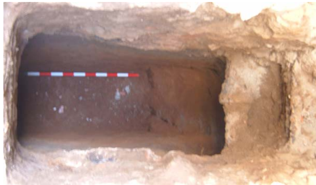
FOTO 3. Foto de la rasa en el seu estat final