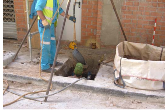
FOTO 2. Treballs realitzats a l'indret de la intervenció