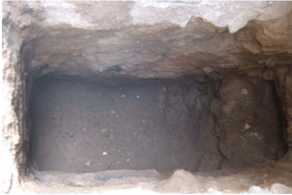
FOTO 1. Foto inicial amb anterioritat a la intervenció arqueològica